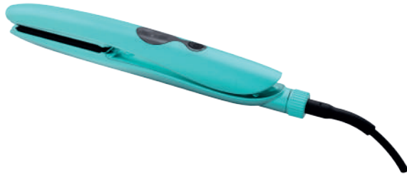
Alisador digital Ceramic turalina dual V

Gracias por elegir Mint, la nueva plancha de pelo profesional con placas flotantes y control de temperatura Microchip. Mint actualiza constantemente su gama de productos, para profesionales del salón y uso doméstico en todo el mundo. Las placas calefactoras flotantes especiales se deslizan suavemente por el cabello. El calor se distribuye uniformemente a través de las placas, lo que es especialmente respetuoso con el cabello. El resultado es un cabello liso con un bonito brillo sedoso. Tu plancha Mint se calienta en sólo 30 segundos. La temperatura se puede ajustar a su calor preferido entre 265°F y 450°F. Las planchas de pelo Mint son fáciles y cómodas de usar gracias a su forma especialmente moldeada, y el cable giratorio de 2,5 metros permite un uso flexible y evita que los cables se enreden. Si se utiliza correctamente el cabello se mantiene sano y con un bonito brillo. Este aparato se puede utilizar tanto en cabello natural como teñido. Esperamos que te diviertas mucho y veas excelentes resultados al peinar con Mint.